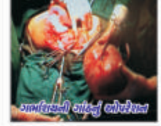
ગર્ભાશયની ગાંઠનું ઓપરેશન