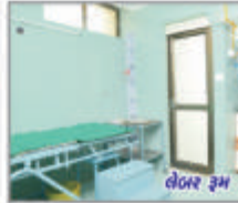
લેબર રૂમ N:I:C.U.