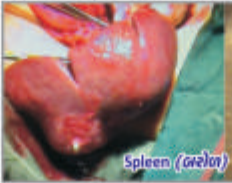
Spleen (બરોળ) Abscess