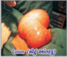
Colon (મોડું બાંધરૂ)